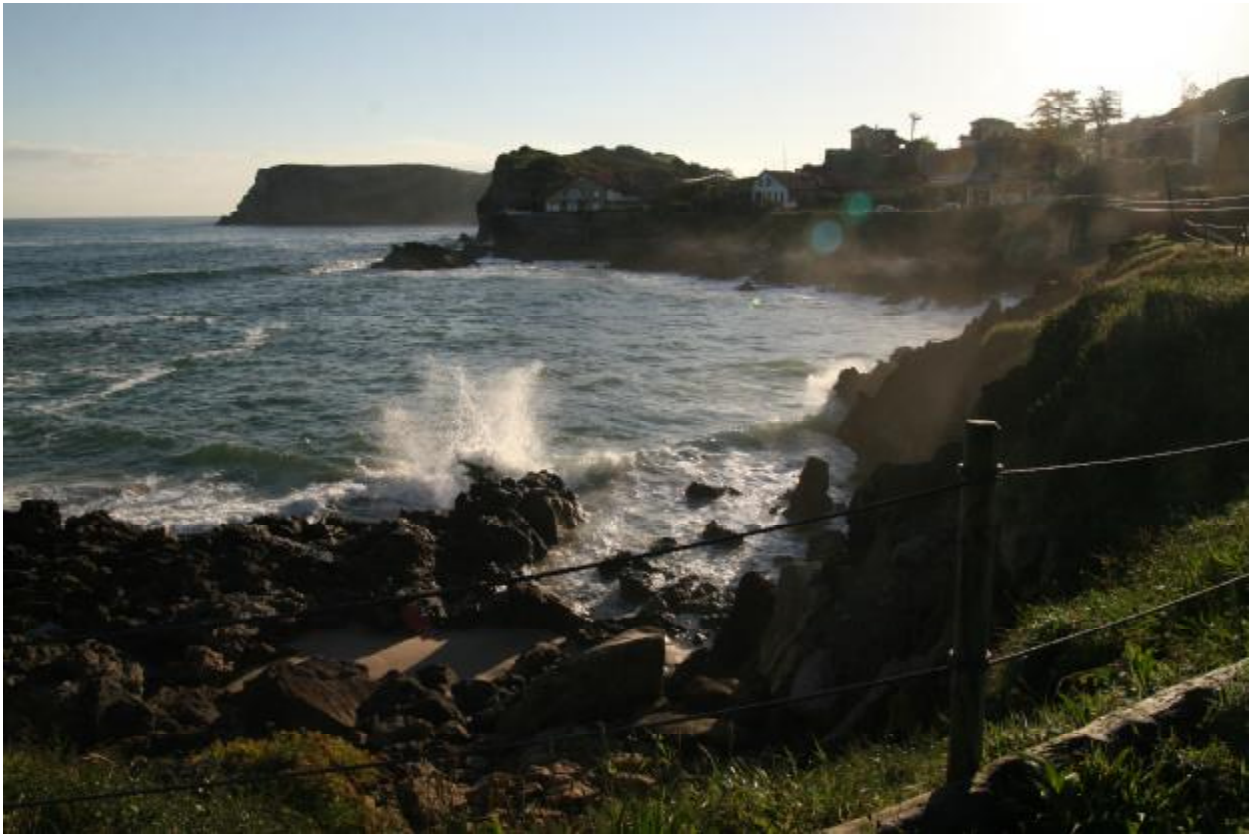
Вид из палатки на атлантический океан.