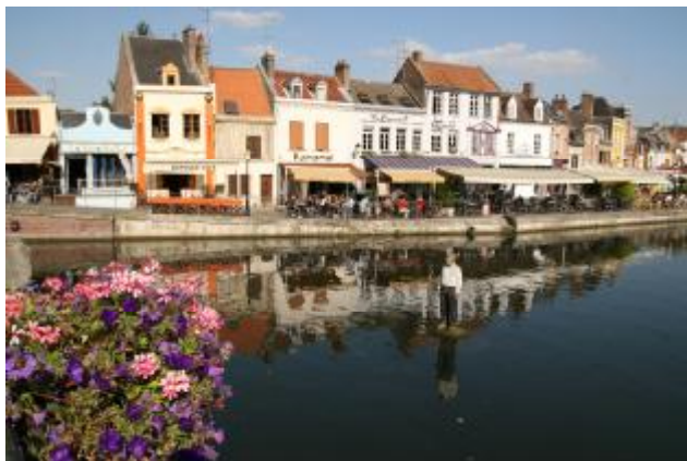
Амьен, район маленьких домиков.

Заехали в Амьен, где находится самый знаменитый из Нотр Дамов собор, занесенный в список наследия ЮНЕСКО. Собор нам понравился. То ли потому, что была суббота, то ли потому, что был какой-то праздник, вход был бесплатный, бесплатно же можно было подняться на крышу и увидеть город и шпиль собора.