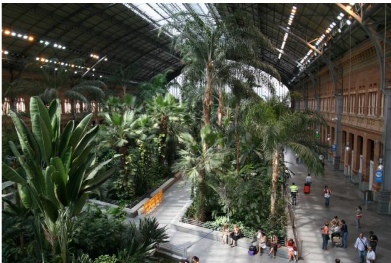
Центральный железнодорожный вокзал Аточа, в котором расположен зимний сад с черепахами.

И вот с сознанием выполненного долга и насладившись изобразительным искусством на долгое время, пошли гулять по городу.